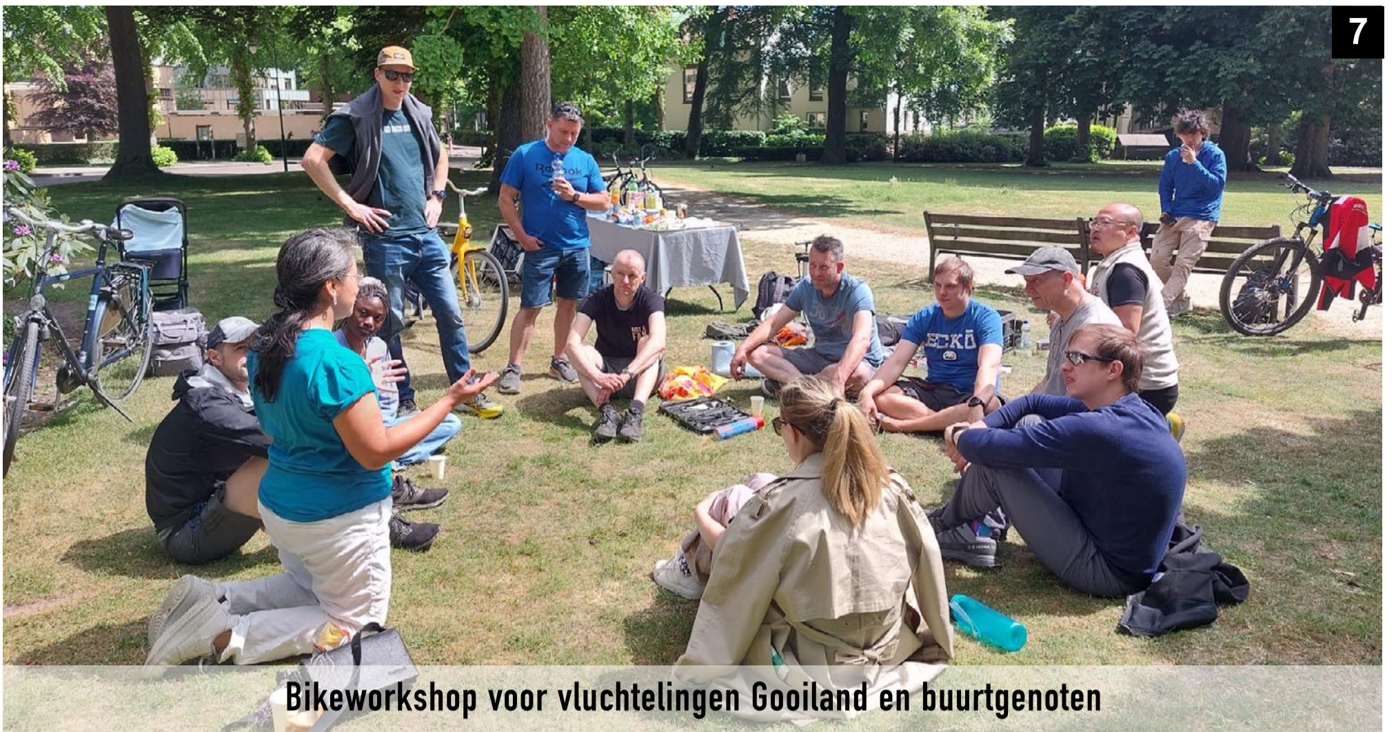
Bikeworkshop voor vluchtelingen Gooiland en buurtgenoten