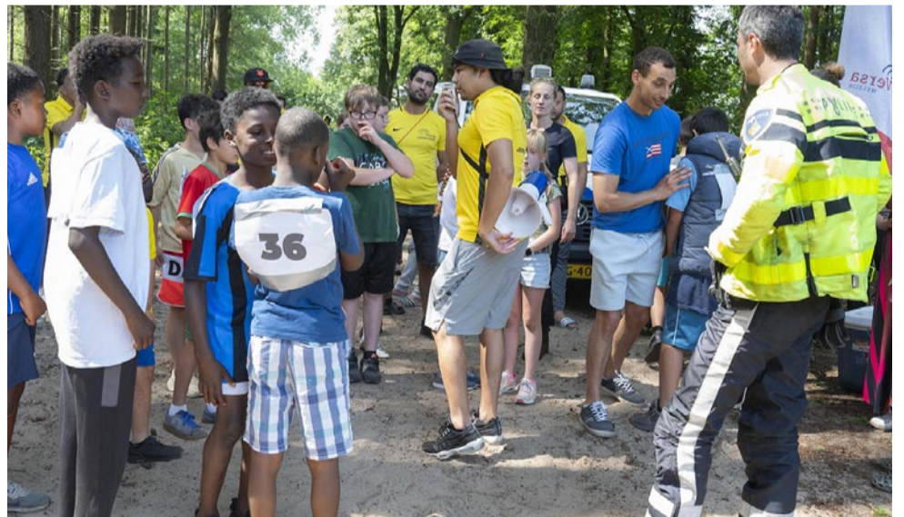
"Een makkie, ze waren echt sloom."