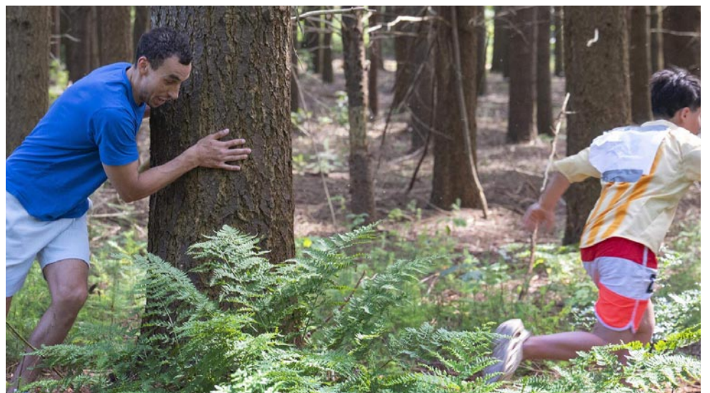
Op de vlucht voor Mustapha, één van de 'hunters'.