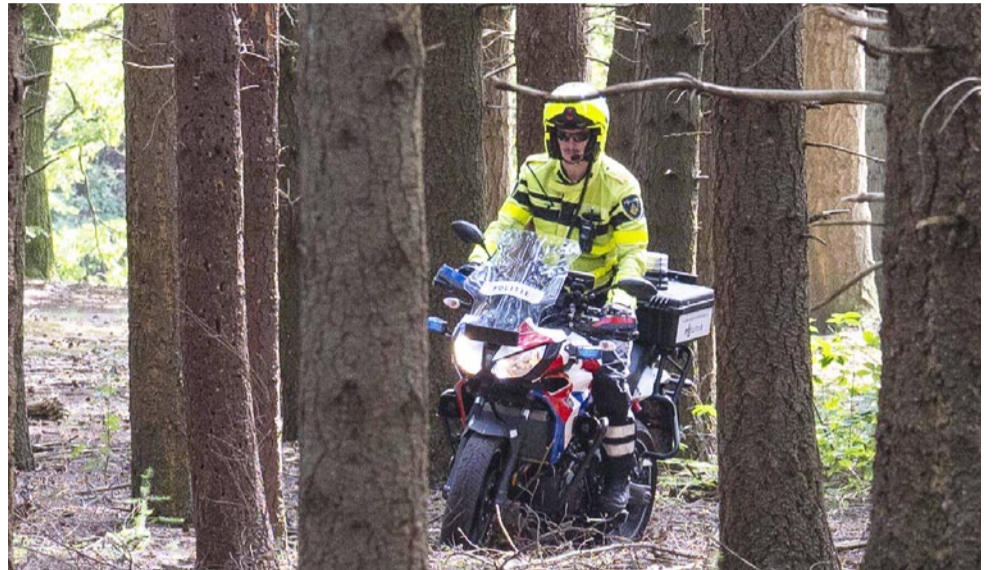
Een agent laveert behendig tussen de bomen door.