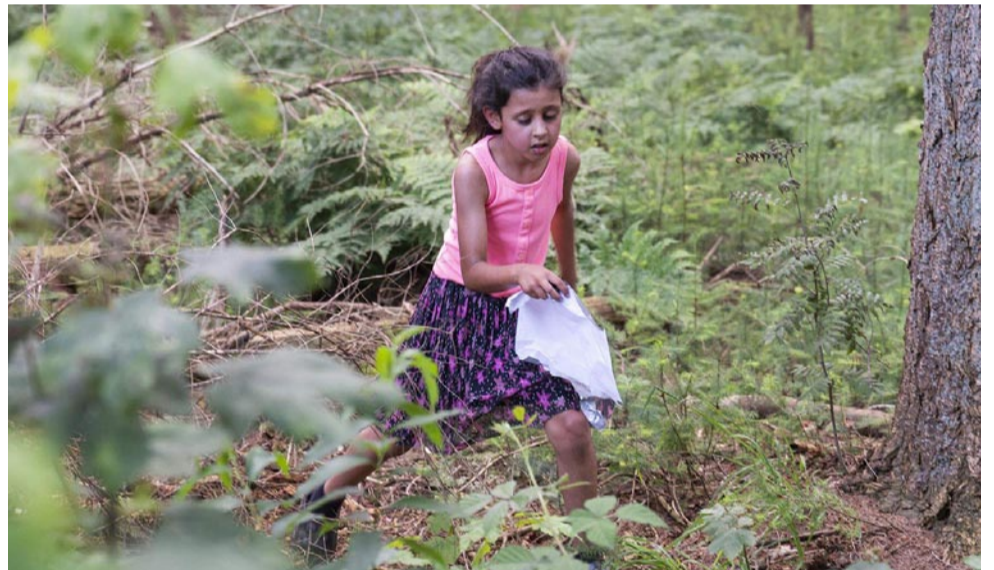
Snel weer het bos in!